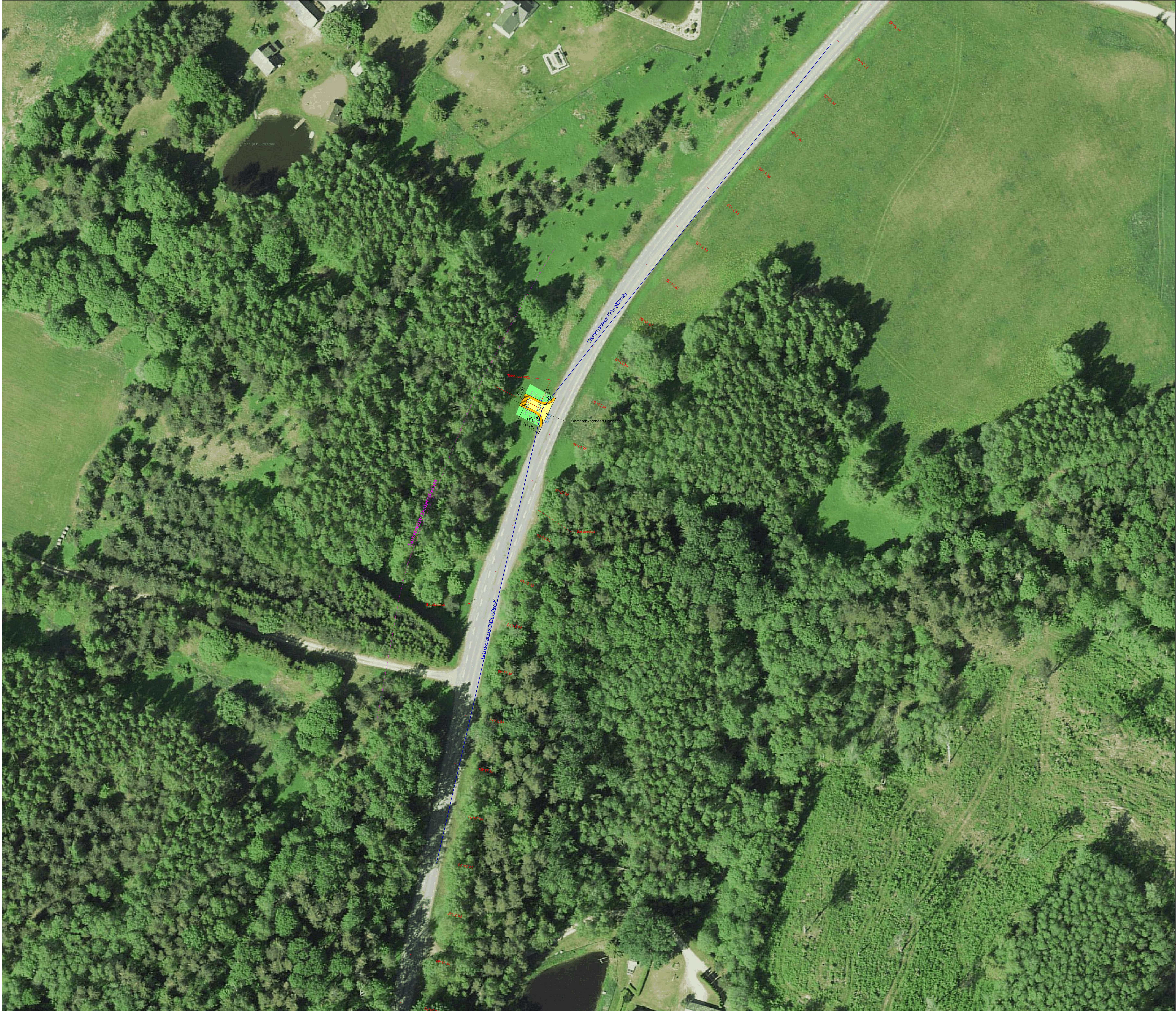
Mahasõidu ristlõige 1:100